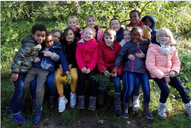
Les élèves de 1ère année.

Après cette balade de 3 kilomètres, il était déjà l'heure de monter dans le car.